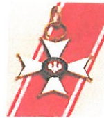
Order Polonia Restituta